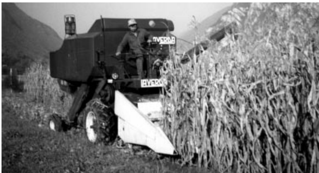
La mietitura del grano nella campagna di Storo