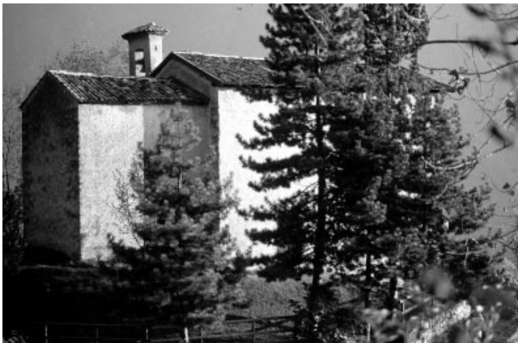
La Chiesetta di S. Lorenzo