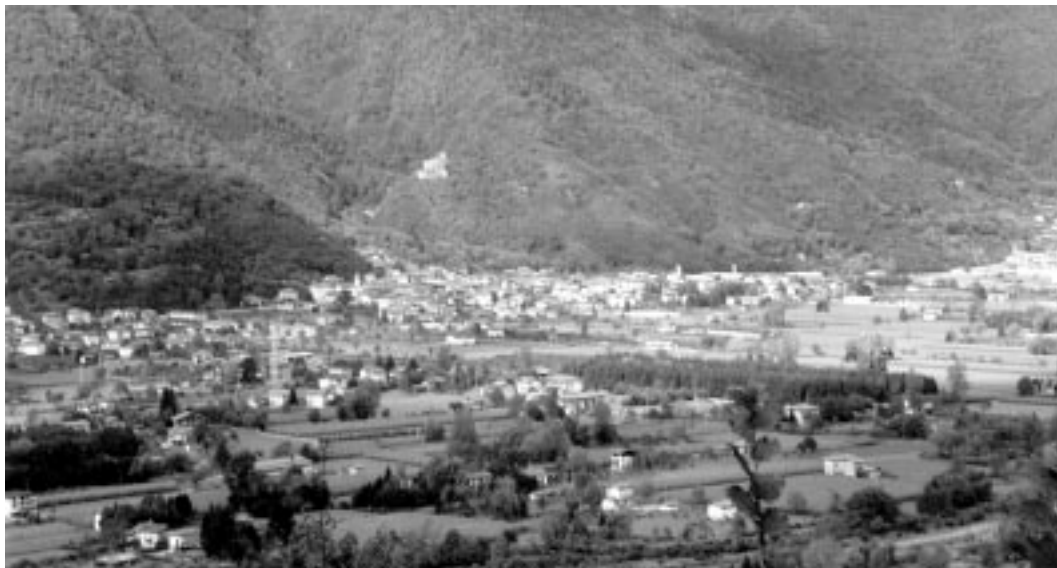
Scorcio di campagna a Lodrone

Ma ciò non ha nessun fine fiscale o di valutazione dei terreni.