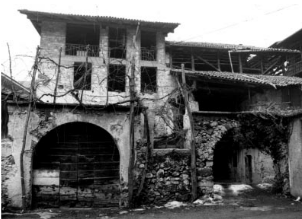
La casa sulla destra, tra via Marconi e il retro della Cassa Rurale, è già stata acquistata dal Comune, destinata all'abbattimento

Mirca tel. 0465 681221 e Christian tel. 0465 681222