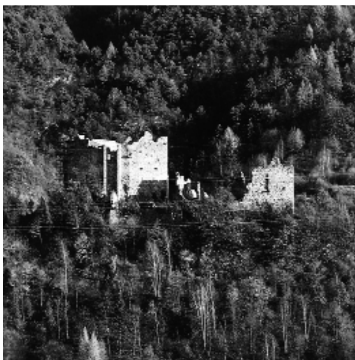
Nella foto Castel Romano

“Ovviamente non mancano i problemi, in primo luogo l'esiguo numero di collaboratori”