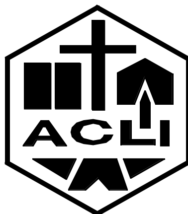
Logo del Patronato A.C.L.I.