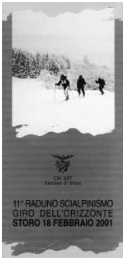
Gruppo "ciaspolatori" durante un'uscita organizzata dalla Sezione - Sat Storo -

Per anno sociale una sezione CAI intende il periodo che va da fine marzo (termine ultimo per i rinnovi dei bollini) al marzo successivo. Certo, per il CAI di Storo, è stato un anno intenso ma "Ordinario". Non c'è stato, per capirci, quel gran subbuglio dell'anno precedente con il Congresso. Tuttavia siamo finiti ugualmente in prima pagina, nostro malgrado, per "attività cinematografiche" di alcuni anni fa. Caduti anche noi nella trappola della devianza giornalistica. E qui ci fermiamo, cerchiamo di dimenticare, e proseguiamo.