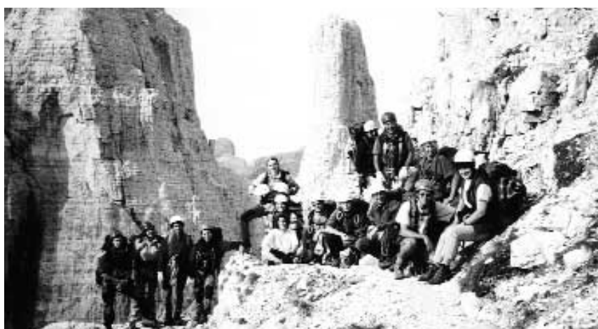
Sentiero “Bocchette Centrali” Gruppo di Brenta. Sullo sfondo il Campanil Basso