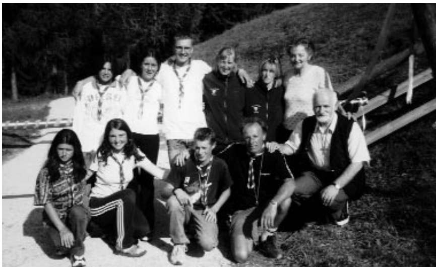
Colonia Alpina - II turno: direttore, assistenti e

Vengono riportate le sintesi delle determine ritenute di maggior interesse per la cittadinanza. Il testo integrale di tutte le determine è presente in libera visione presso gli Uffici Comunali e sul sito Internet del Comune di Storo.