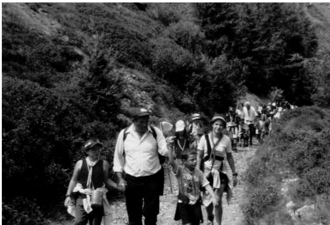
Colonia Alpina - II turno: in cammino verso