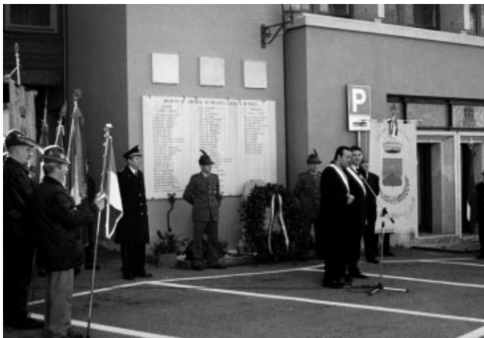
4 novembre 2001: commemorazione dei Caduti