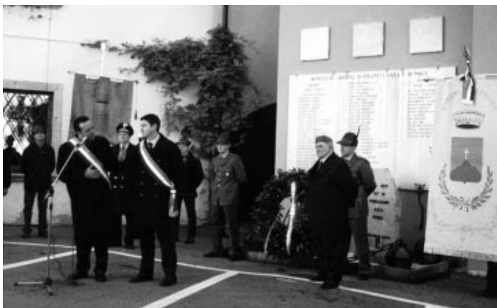
4 novembre 2001: commemorazione dei Caduti

Sul sito Internet del Comune sono pubblicati i nati, i morti, i matrimoni nel nostro Comune