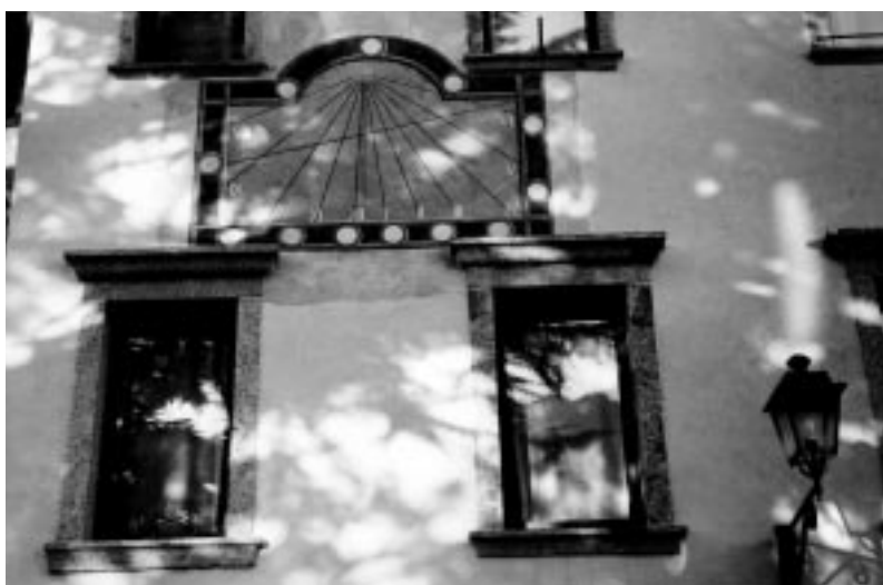
La meridiana restaurata sulla facciata del Municipio in Piazza Europa a Storo

Un ultimo accenno al monumento ai Caduti, oggi di aspetto cimiteriale, al quale penso si debba conferire un rigore civile integrato a tutta la piazza. Un'asta in acciaio, atta a sostenere un sottile gonfalone tricolore, ed un idoneo supporto per la posa di una corona, sono posti su una pavimentazione semicircolare leggermente rilevata di un gradino rispetto all'intorno.