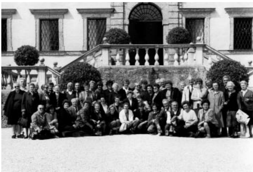
Gli "studenti" della Terza Età in gita a Salisburgo (Maggio 1991)

Vi possono partecipare anche familiari degli iscritti o simpatizzanti... perché è un po' il nostro strumento di propaganda.