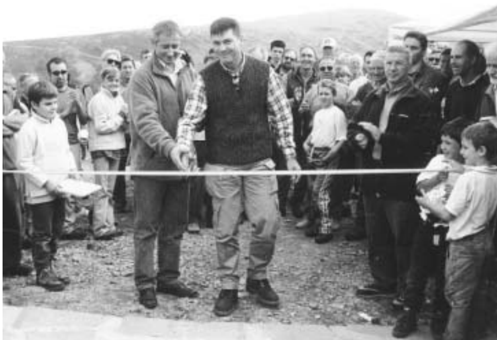
L'inaugurazione della malga Vacil

Il dibattito si è intrecciato sui temi più cari agli amanti della montagna: spopolamento, desertificazione, crisi della zootecnia, necessità di modificare il modello di sviluppo, problemi da traffico, necessità di un turismo sostenibile, possibilità di equilibrio fra caccia e montagna. Su una cosa sono sta-