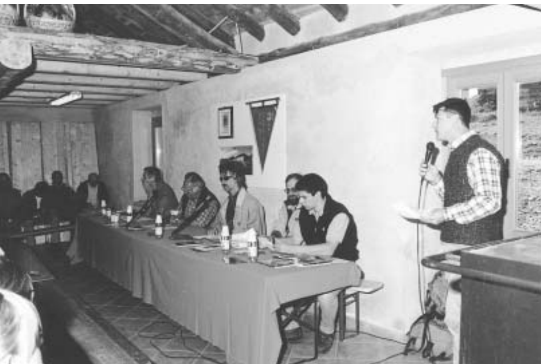
Il tavolo del convegno

ti tutti d'accordo: la montagna sta rischiando di morire perché le autorità (soprattutto quelle europee, ma non se la cavano male nemmeno quelle nazionali e provinciali) ne sottovalutano i problemi. Perché vivere in montagna è più costoso e faticoso che vivere in città. L'invito forte che è giunto da tutti gli intervenuti è alla concretezza. C'è, infatti, il reale pericolo che finito l'Anno Internazionale della montagna, che se non altro ha avuto il merito di accendere i riflettori su una realtà misconosciuta, la montagna ritorni con la sua solitudine e con i suoi grattacapi a combattere la battaglia contro il degrado aiutata da pochi coraggiosi.