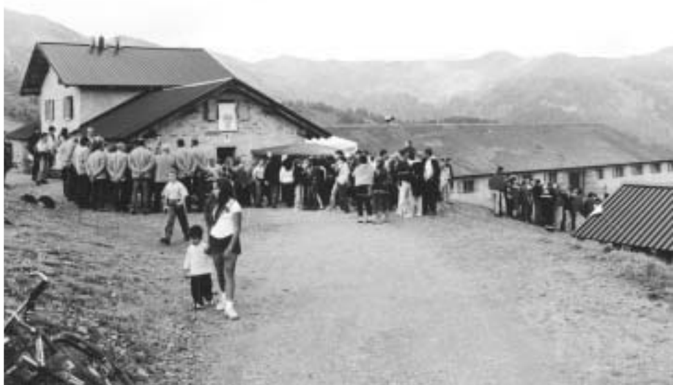
La malga Vacil rimessa a nuovo

Ma non ci saranno solo allevatori a Vacil. Il Comune, infatti, ha messo a disposizione della sezione SAT una stanza che non sarà utilizzata dall'azienda agricola. Dopotutto anche gli alpinisti contribuiscono a mantenere in salute la montagna.