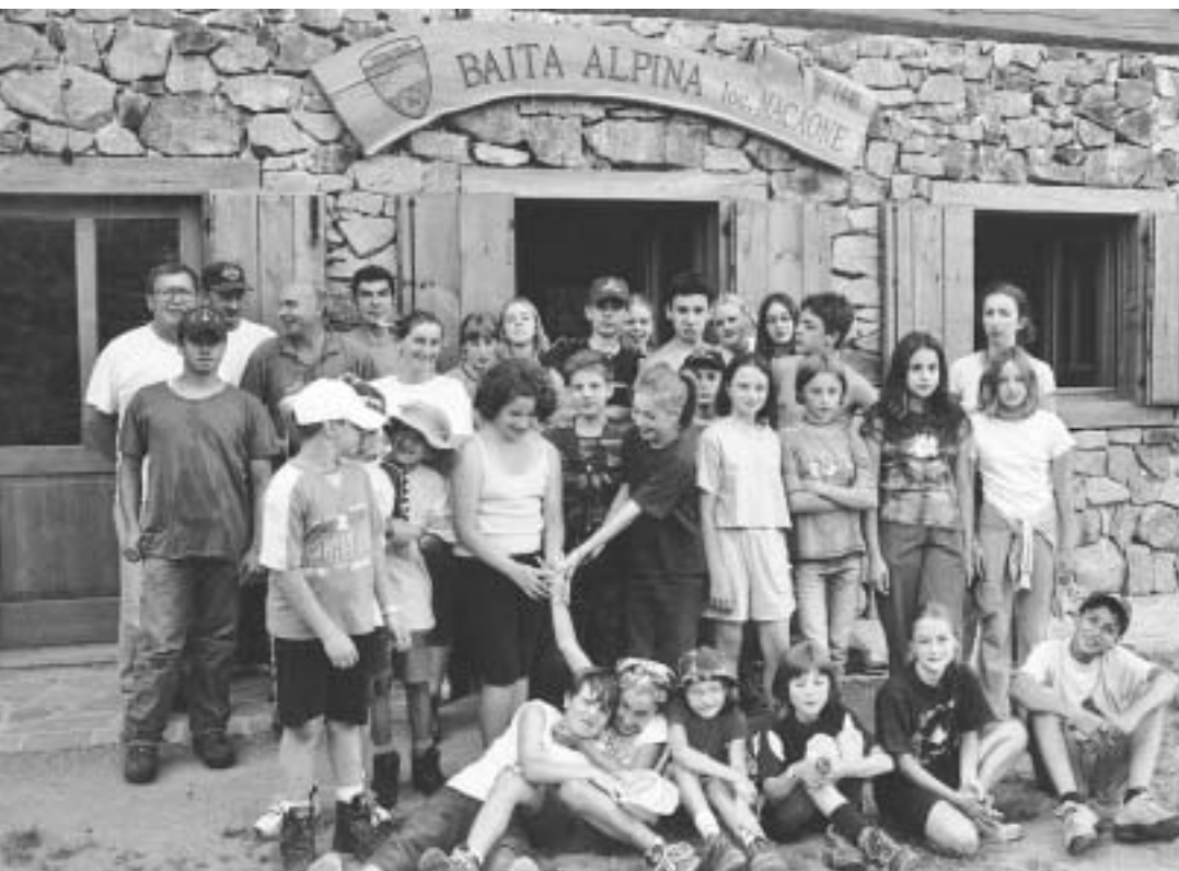
Il gruppo che ha partecipato alla gita in località Macaone

"La montagna e l'occasione aiutano ad incontrarsi ed a superare le distanze che, a valle, tengono distante la gente"