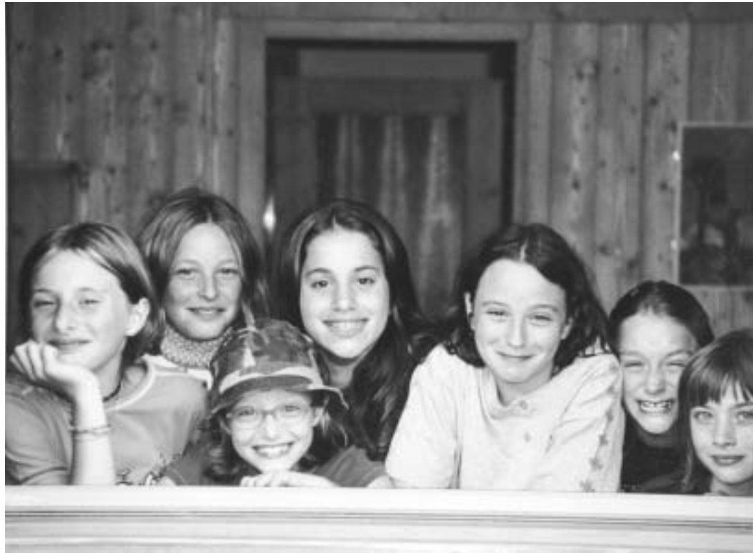
Alcuni ragazzi del gruppo

“Il volontariato è l'unica forza da cui è legittimo attendarsi un'azione di contrasto ai mali della nostra società”