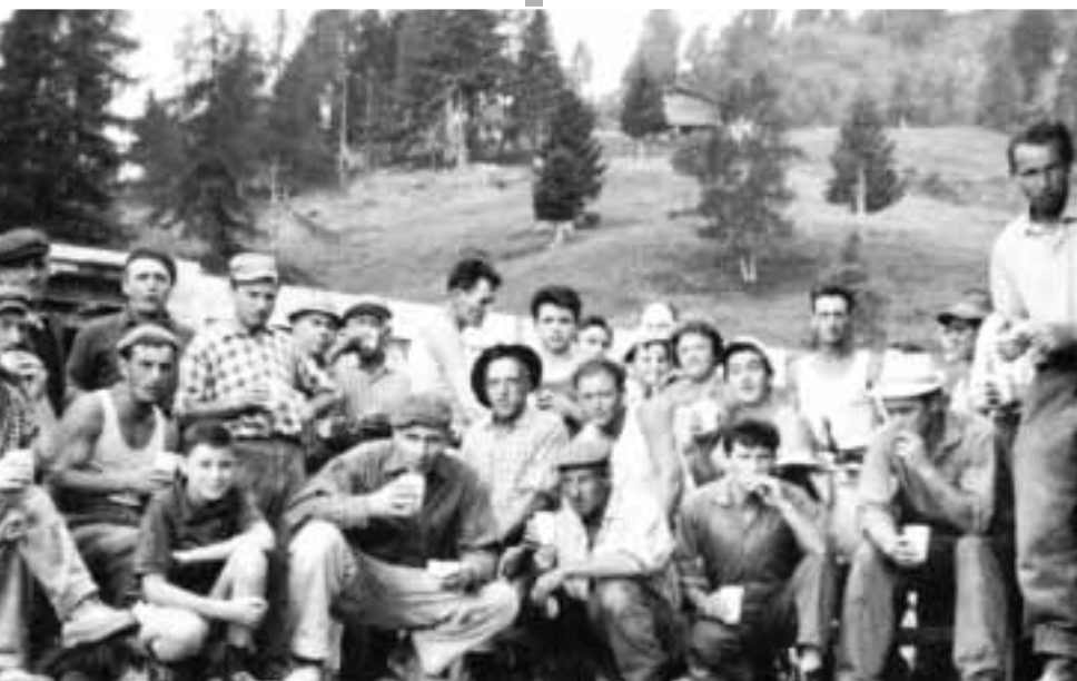
Casa Alpina: anno 1963

Le fotografie sono state raccolte grazie al contributo di molte persone che hanno ricercato nei propri cassette belle immagini che rappresentavano il clima di serenità e di gioia che si è vissuto e si vive durante i turni estivi. Importante documento è stato il diario di don Ezio, dal quale sono state tratte numerose immagini e interessanti articoli di giornale. La mostra fotografica è stata allestita con lo scopo di ricordare i 40 anni trascorsi, ma anche per porre all’attenzione di grandi e piccoli, i comportamenti e le trasformazioni che sono avvenute. Inoltre la raccolta fotografica voleva far conoscere la storia della Casa Alpina a coloro che l’hanno conosciuta solo recentemente e far rivivere ricordi piacevoli alle persone che hanno vissuto i primi anni di quest’esperienza. Fra questi vogliamo ricordare indistintamente i volontari, gli animatori, le cuoche, i direttori, i sacerdoti, gli assistenti e i ragazzi. Interessante rivedere anche i cambiamenti della struttura, passando dalle tende ad una casa accogliente e funzionale, ma è piacevole notare come lo spirito di condivisione e di accoglienza che sostiene la Casa Alpina sia rimasto vivo e forte in tutti questi anni. Le fotografie della mostra sono state ora raccolte in grandi quadri che resteranno appesi in colonia, per testimoniare la vitalità di questa importante struttura. La Casa Alpina è nata come una struttura di tutta la comunità, così ha operato in