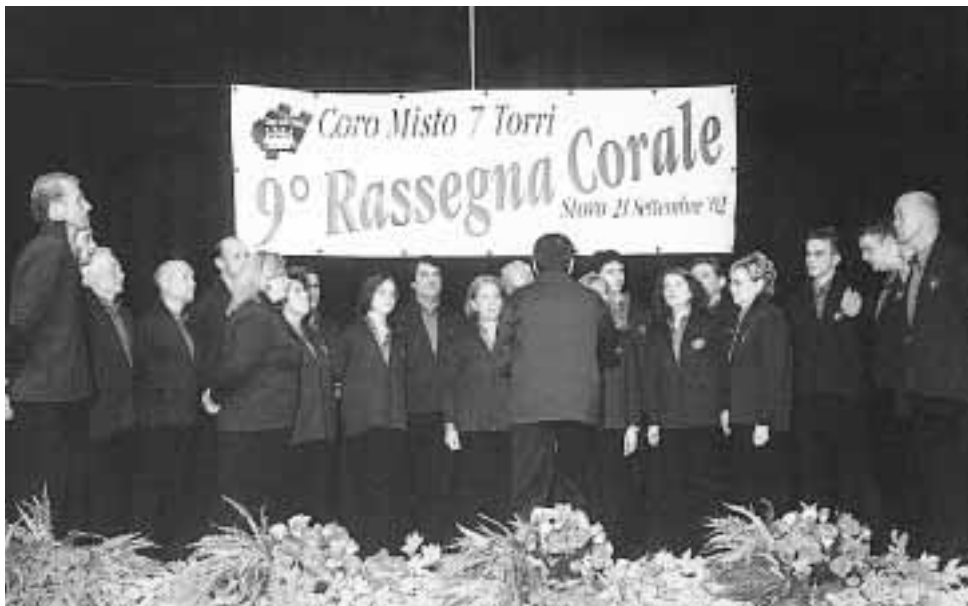
Coro Sette Torri: 9° Rassegna Corale

“senza sacrifici e senza qualche piccola rinuncia, specialmente nel sociale, non si va molto lontani”