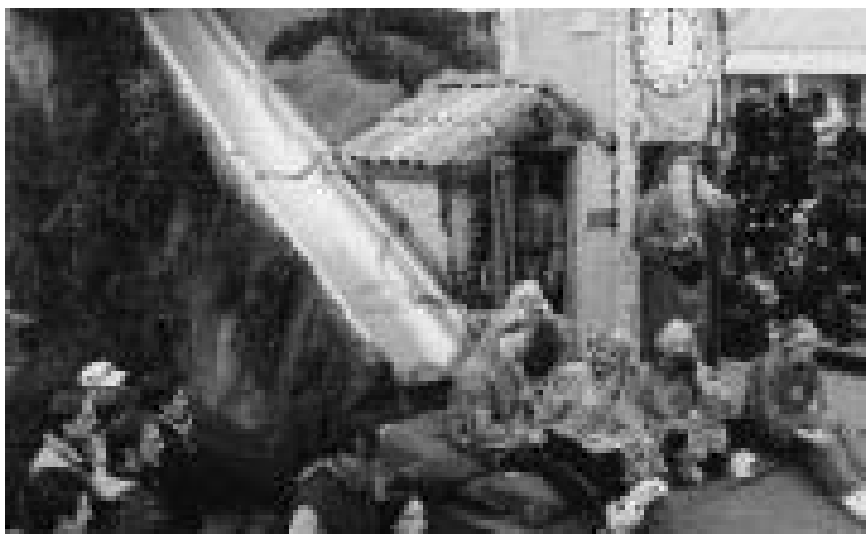
Carnevale 2003: "Rocca Pagana"