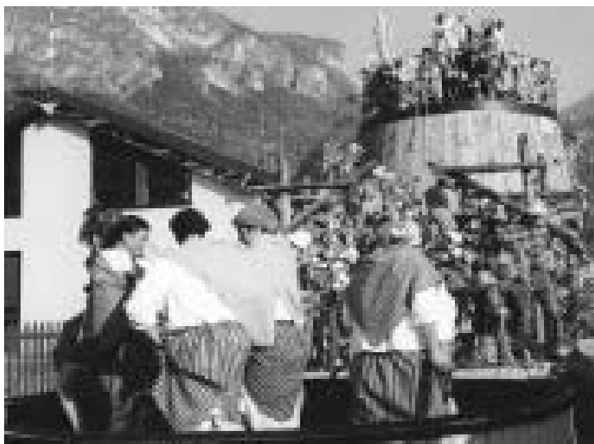
Carnevale 2003: "Vendemmia"

Si delibera di cedere, vendere e trasferire in assoluta proprietà al Consorzio B.I.M. del Chiese al prezzo complessivo concordato di Euro 177.809,49, parte del palazzo Conventino di Lodrone (p.m. 2 della p. edif. 84 e p. fond. 339/2) da destinare a sede del costituendo Ecomuseo della Valle del Chiese.