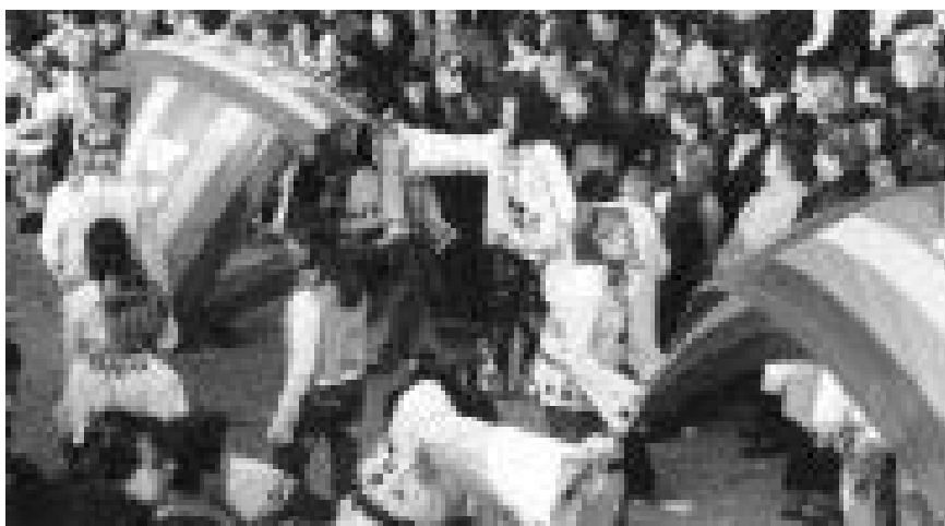
Carnevale 2003: "Peace & Love"

Il Responsabile del Servizio Tecnico determina di approvare i lavori, affidandone l'esecuzione in economia alla Ditta Elettrotecnica Storese di Storo, per un importo complessivo di Euro 28.200.