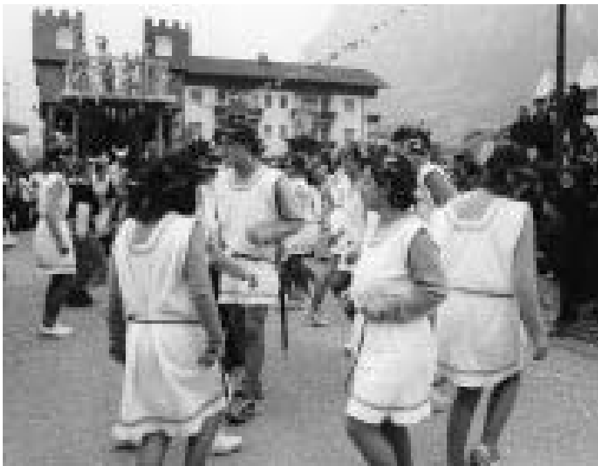
Carnevale 2003: "Asterix e Obelix. Missione Savoiaro"