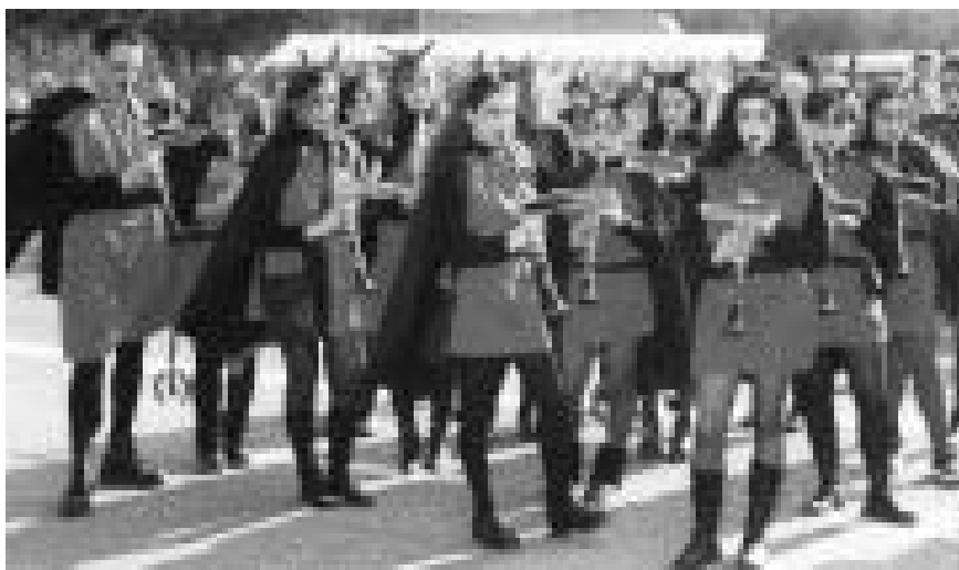
Carnevale 2003: "La Banda"

Il Responsabile del Servizio Tecnico determina: – di approvare il programma di interventi per opere di manutenzione ambientale per l'anno 2003, come redatto dall'Ufficio Tecnico comunale, che prevede una spesa complessiva di Euro 293.000; – di presentare domanda di contributo provinciale pari al 90% della spesa.