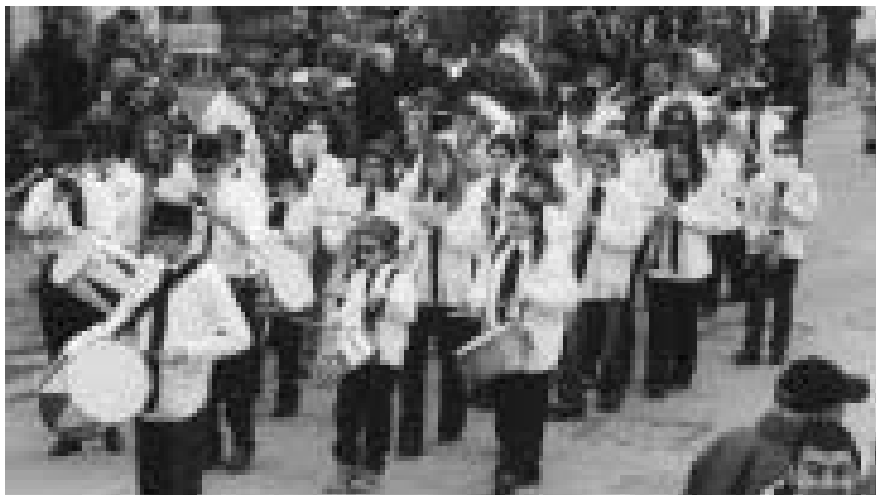
Carnevale 2003: "La Bandina"

Il Responsabile sostituto del Servizio di Segreteria determina di concedere al Comitato montano Spessa – Fastaggio il contributo di Euro 20.000 a parziale copertura della spesa di realizzazione dell'acquedotto per l'approvvigionamento idrico dei fabbricati montani in località Fastaggio in C.C. Storo.