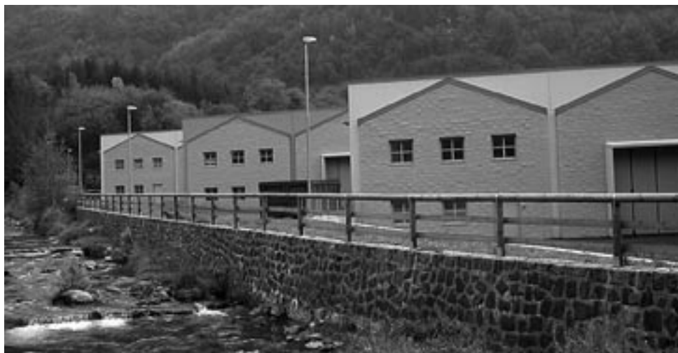
Il Centro BIC di Pieve di Bono, sede del Telecentro Gabriele

Un servizio di “trasporto pubblico locale a chiamata”