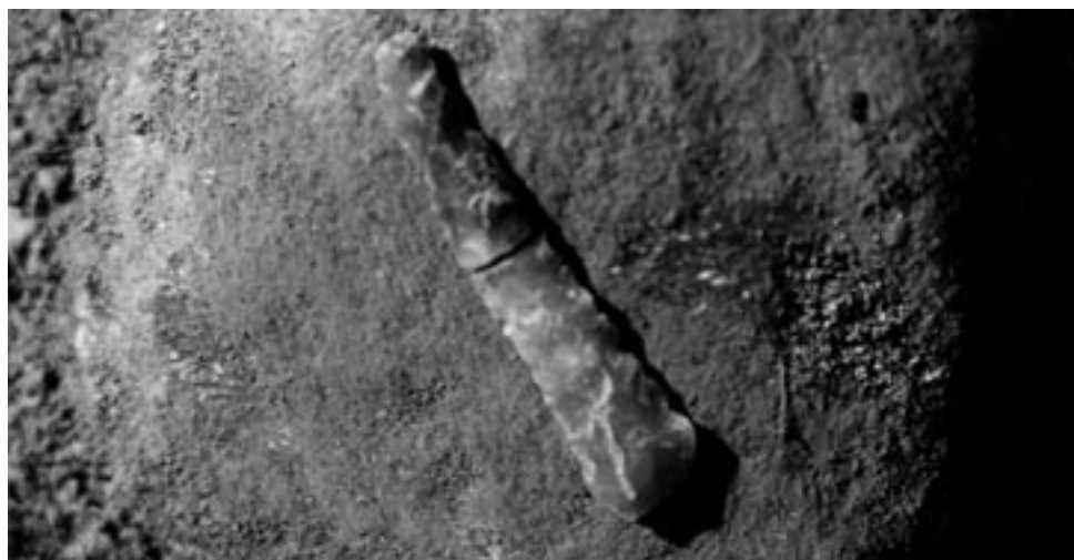
Scavo di Vacil: un coltellino in selce

Sotto: scavo di Vacil – frammento di ceramica (ansa di vaso)