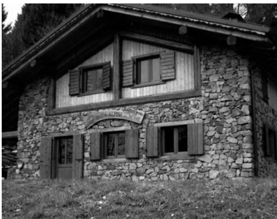
La “Baita alpina” ristrutturata in località “Macaone” di Tonolo

In uno scenario alpestre verdeggiante di pascoli e attorniato da conifere secolari, si è inaugurata sulla montagna di Tonolo in località “Macaone” il 13 Luglio 2003 la BAITA ALPINA, risorta su un rudere. È sicuramente una splendida realtà, frutto di un impegno assiduo, non solo degli Alpini ma dell'intera comunità lodronese.