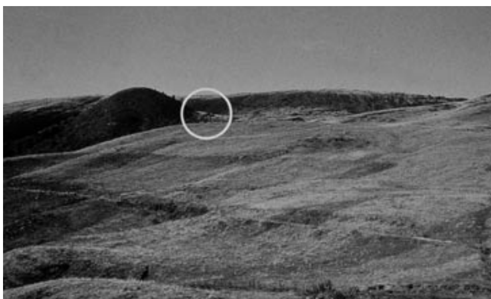
Localizzazione del sito archeologico di Dosso Rotondo (Doredont)

Il pubblico, sabato 25 ottobre, non sarà stato dei più numerosi, all'oratorio di Storo: d'altronde sul palco non c'era l'Orchestra Casadei. Tuttavia gli organizzatori (Centro Studi Judicaria e Ufficio Beni archeologici della Provincia, con la collaborazione del Comune e del Consorzio Bim del Chiese) erano soddisfatti: infatti sono riusciti a coinvolgere parecchie decine di persone, venute per ascoltare relatori di tutto rispetto a livello nazionale.