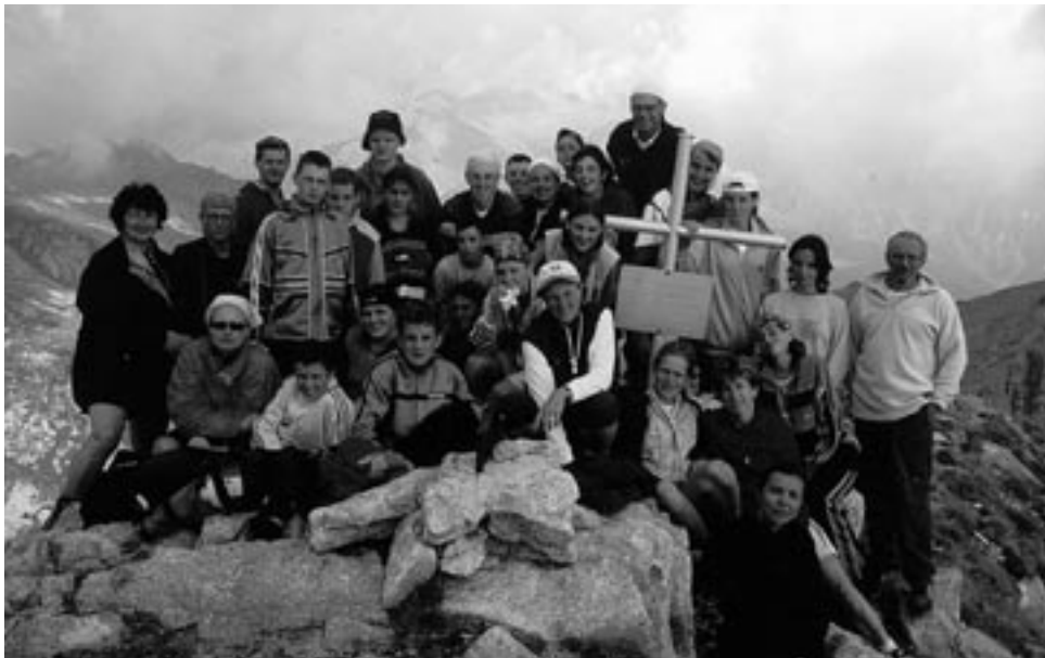
Colonia alpina III turno: la mitica "riconquista" del monte Bruffione dopo anni di assenza