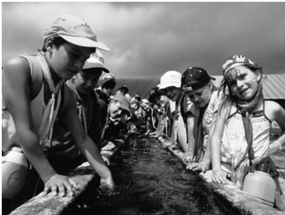
Colonia alpina III turno: gita a Cima Rive – abbeveratoio nei pressi di malga Serolo

Servono collaborazioni forti tra genitori e scuola