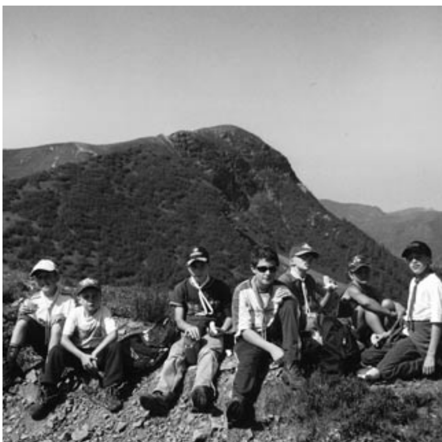
Colonia alpina Il turno: un gruppo di ragazzi durante una gita