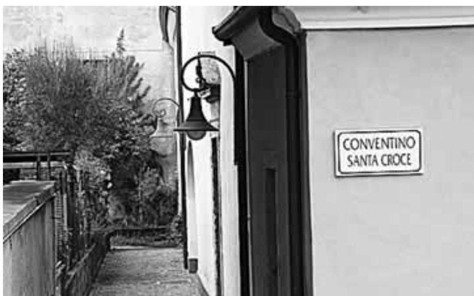
Scorci del Conventino di Lodrone

Sulla riva sinistra del fiume Caffaro, la nobile famiglia Lodron fece costruire da maestranze provenienti dalla vicina Lombardia una residenza principesca ultimata, dopo decenni di lavoro, nel 1575, come testimonia la data inserita sotto il cornicione del corpo centrale.