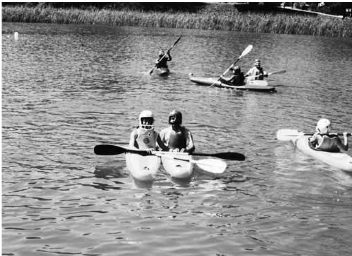
Un momento di pausa dopo la gara di canoa polo