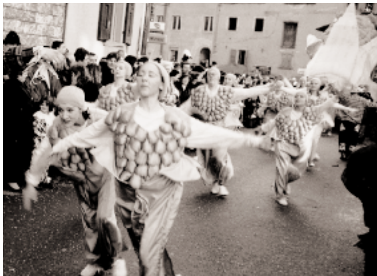
Le "pannocchie" del carro vincitore al carnevale di Storo 1998