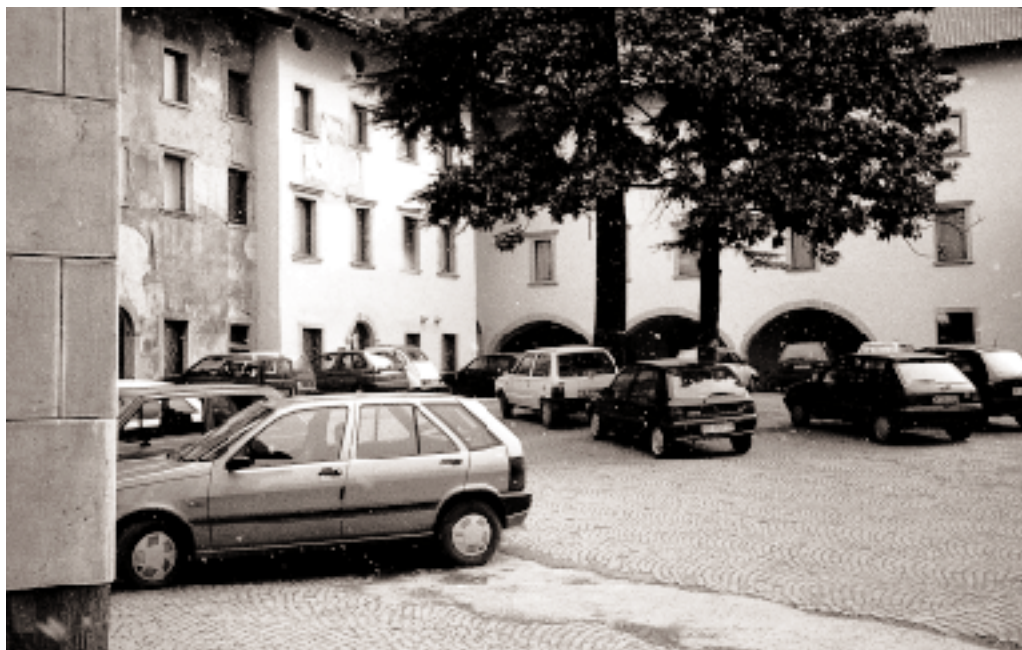
La piazza del Municipio: avrà presto una sistemazione più funzionale