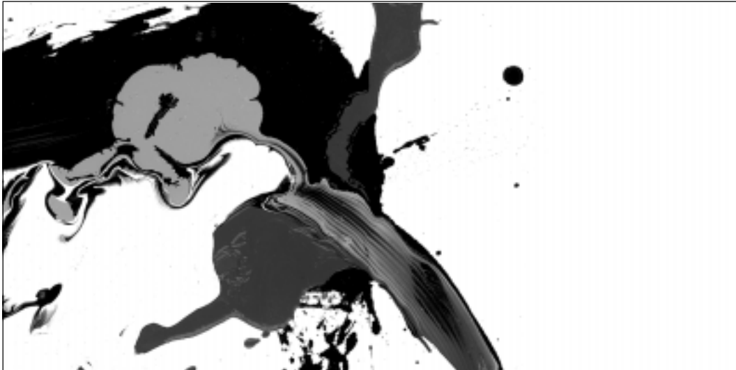
Le opere dell'artista Alessandro Zulberti