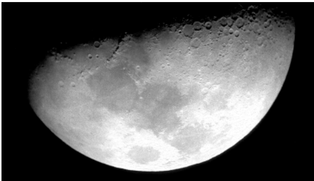
Foto della Luna scattata il 26/12/1998 con fotocamera digitale Nikon