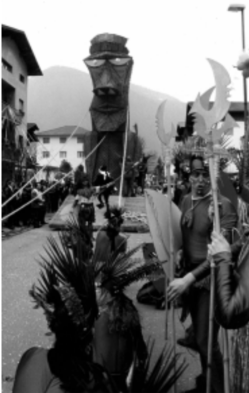
Stranezze del calendario: il carnevale, fatto anche in quaresima, è stato vinto da quelli di Pasqua