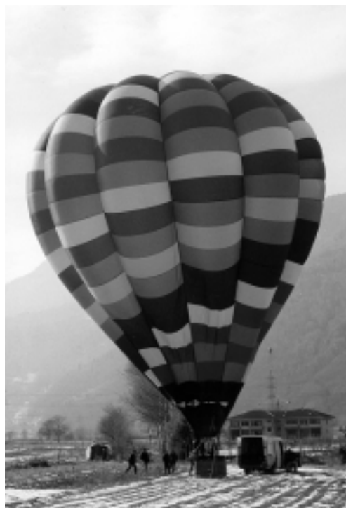
Proprio come un ufo: c'è chi giura di averla vista ma tutti gli altri non ci credono

Il Sindaco precisa che questo problema ha bisogno di una soluzione, che non può