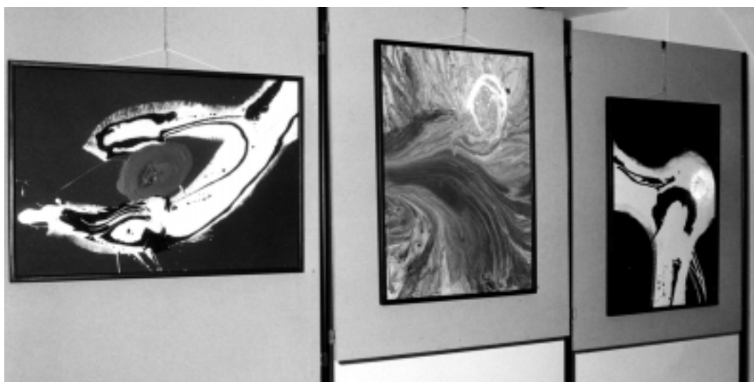
Alcune opere in esposizione

È molto bello che dei giovani della nostra comunità si impegnino anche in questi campi, che sono stati in gran parte trascurati, per cui si è ricorsi ad artisti e competenze fuori zona. Nel nostro futuro ci sarà sempre più spazio per una qualità artistica non solo in modo eccezionale, ma nella vita e negli oggetti di ogni giorno.