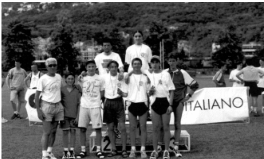
Atleti della Valchiese con il loro Presidente

Ottima la posizione nell'Hinterland Gardesano, dove ha conquistato 18 centri su 18 gare nella categoria B1. Ha ottenuto inoltre 4 vittorie nel circolo giudicariense.