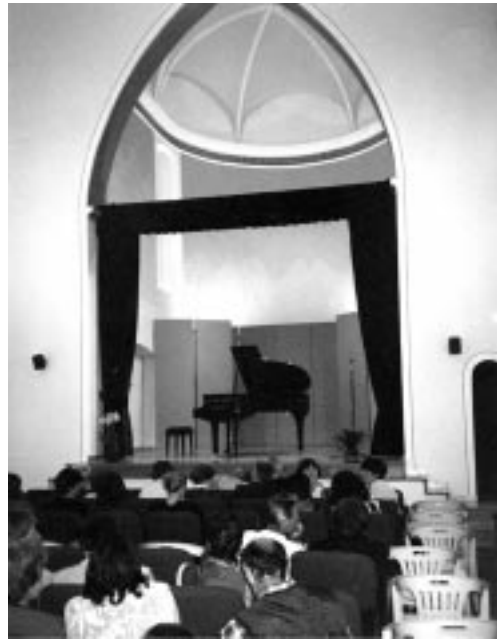
Inaugurazione Teatro di Lodrone nella ex Chiesa del Conventino, vista d'insieme

sposti dall'impresa costruzioni Dalbon di Tione e vistati dal direttore dei lavori geom. D. Mezzi e che quantifica l'importo in circa £ 120.000.000.