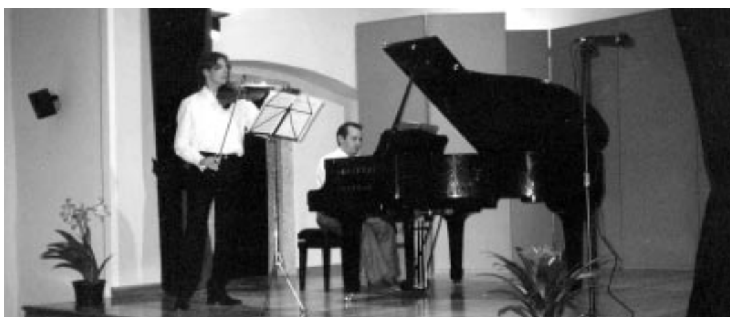
Giugno '99 - Inaugurazione Teatro di Lodrone nella ex Chiesa del Conventino Concerto eseguito dai "maestri" della scuola musicale