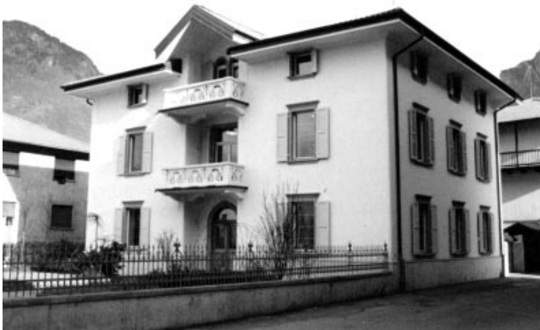
La sede del Consorzio elettrico di Storo, aperta nel 1994. Nell'edificio si trovano: - gli uffici per il pubblico, la sala per le riunioni - il centro di telecontrollo e telecomando degli impianti di produzione dell'energia elettrica

personale si sono dimostrati molto disposti ed aperti nei suoi confronti, attivando un rapporto fortemente collaborativo, molto valido e dinamico.