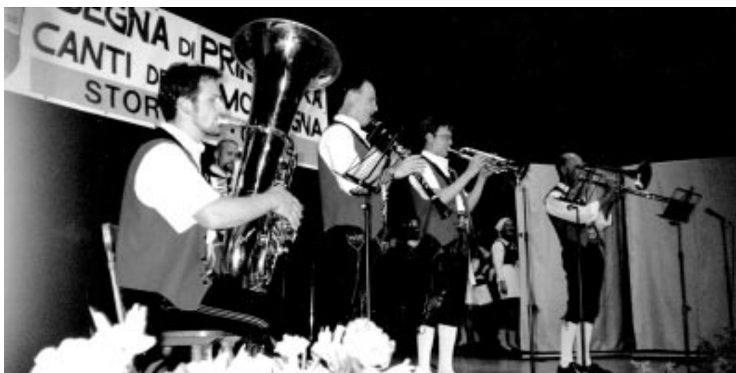
Rassegna di Primavera di Canti della Montagna 5-6 giugno 1999