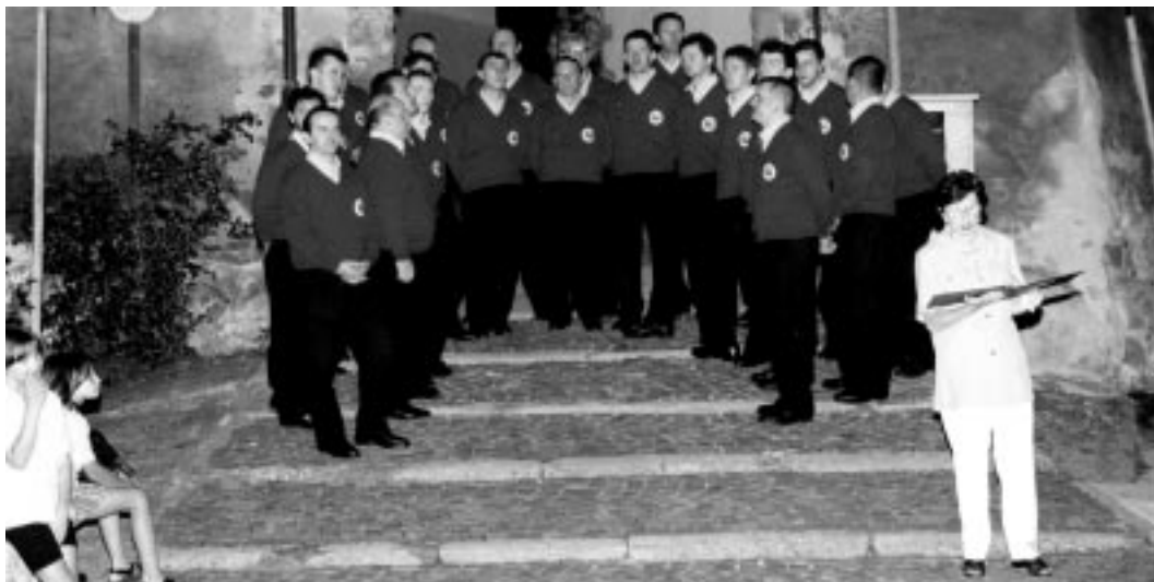
10.07.1999 - Concerto di Monterchi (Arezzo)