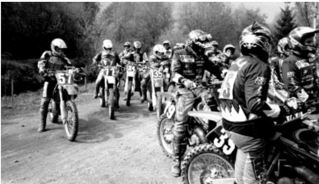
Gara di motocross al campo di Storo