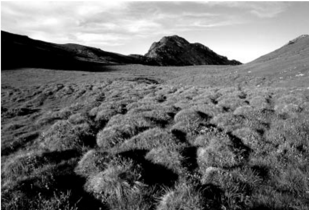
La Tombea con le sue caratteristiche Tombe