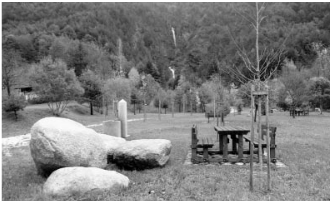
Il parco di Fontana Bianca