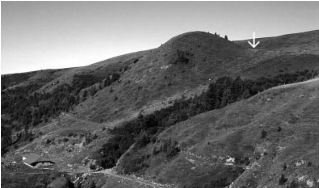
Veduta di Dosso Rotondo: la freccia indica il punto dove è stato scoperto il sito archeologico