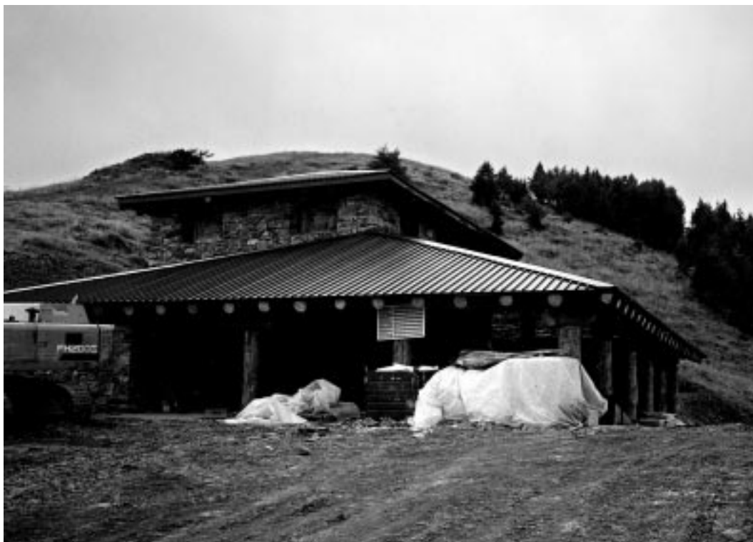
Ristrutturazione a Malga Capre. Complimenti a CMF di Darzo e progettista Zanetti